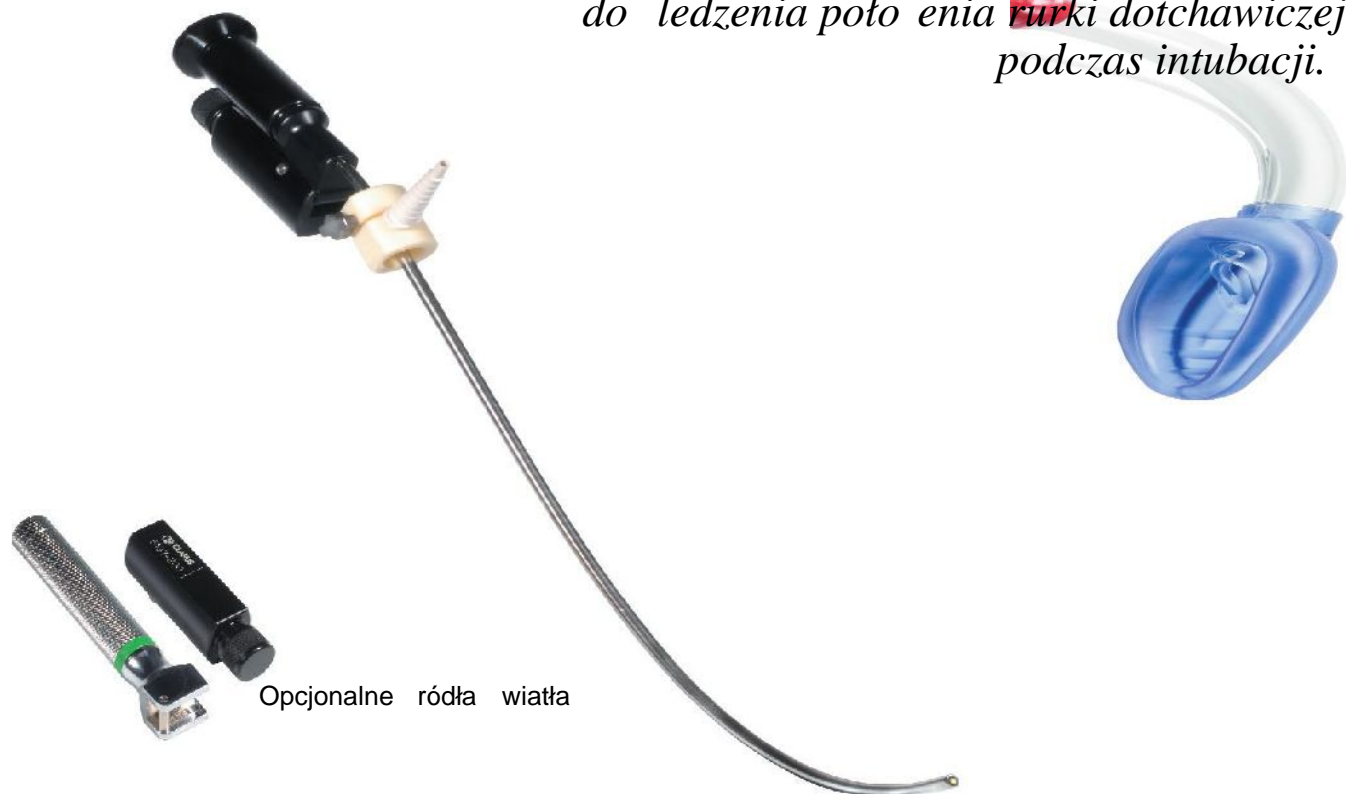
Opcjonalne ródła światła

wziernik światłowodowy do ledzenia położenia rurki dotchawiczej podczas intubacji.